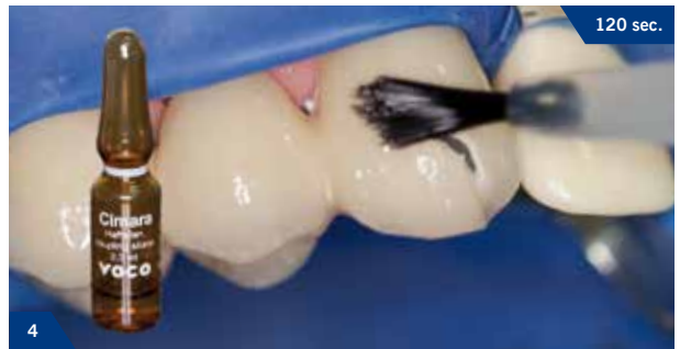
4 Dünnes Auftragen des Cimara Haftsilans auf den Keramikrand und die Metalloberfläche. 2 Minuten trocknen lassen 120 sec.