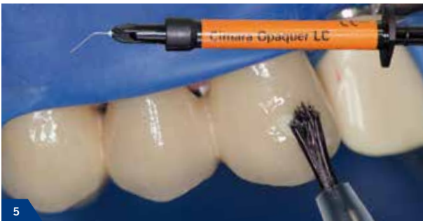
5 Dünnnes Auftragen des Cimara Opaker LC. 40 Sekunden Lichthärtung