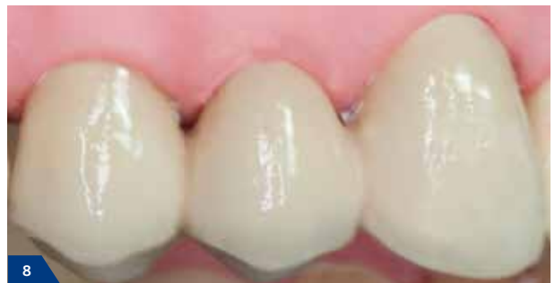
8 Eine wieder hergestellte ansprechende, ästhetische Restauration