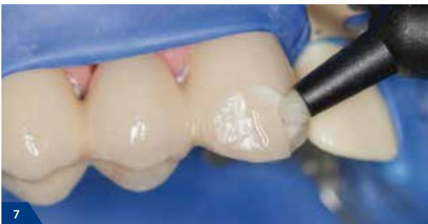
7 Verarbeitung des lichthärtenden Composites entsprechend der Gebrauchsinformation