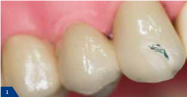
1 Fraktur einer Verblendkeramik