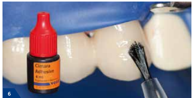
6 Auf die vorbereitete Keramikoberfläche das Cimara Adhäsiv dünn auftragen, mit einem schwachen Luftstrom fein verteilen und 20 s lichthärten.