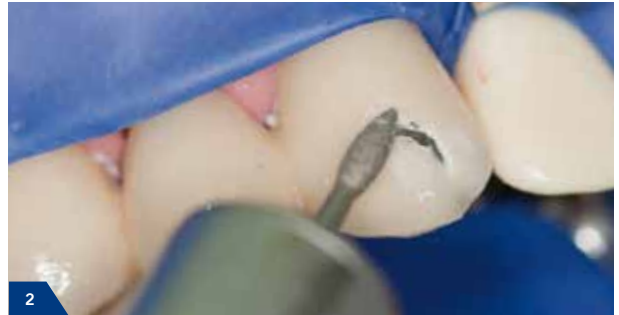
2 Aufrauung der Metalloberfläche und Ansträgung der Keramikränder mit einem Diamantbohrer auf 2 mm