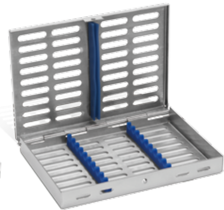
blau/ blue REF 11990BL