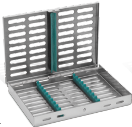
Innenmaße/ inner dimensions: 180 mm x 130 mm x 25 mm grün/ green REF 11990GR

Instrument Tray for 5 instruments – ideal for individual assortments as prophylaxis tray (PZR)