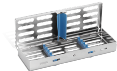
blau/ blue REF 11993BL